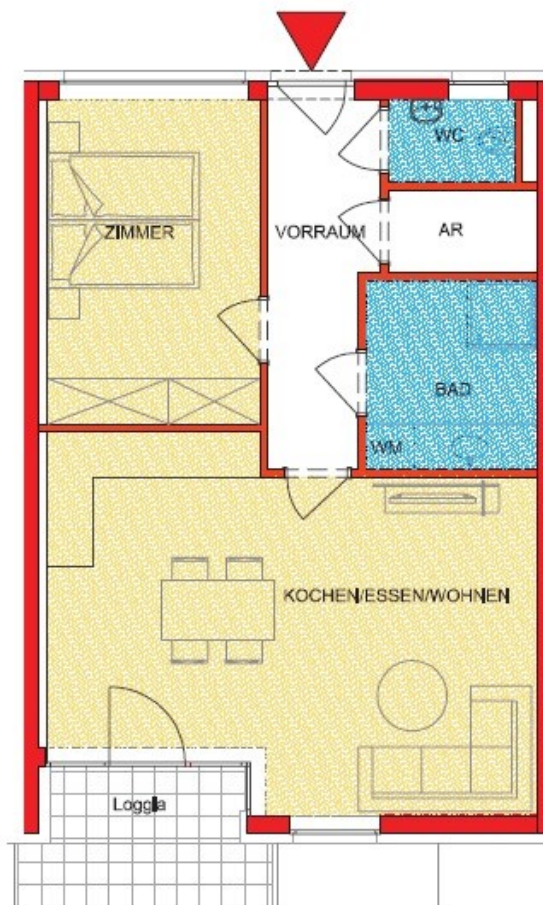
Lage Top 14