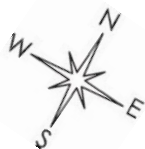
Lage Top 7