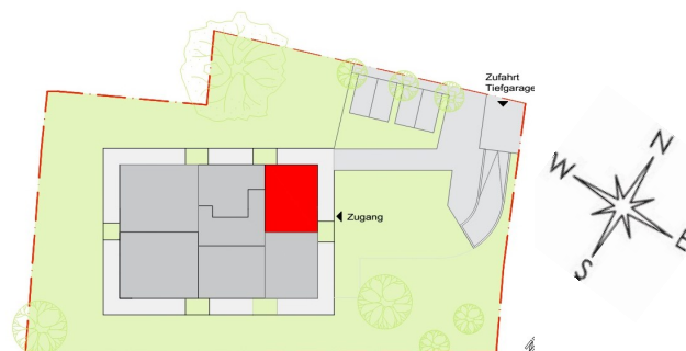
Lage Top 23

Bauträger Mag. Hofstätter & Kletzenbauer GmbH