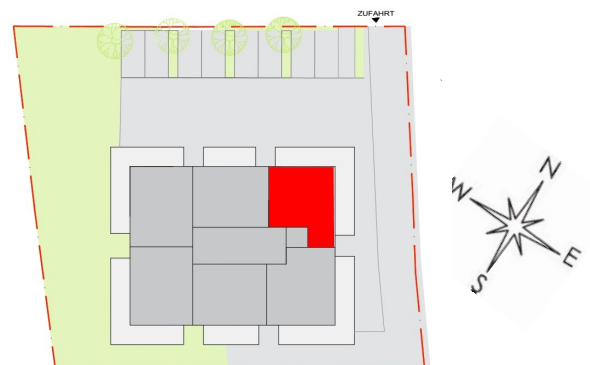
Lage Top 17

Bauträger Mag. Hofstätter & Kletzenbauer GmbH