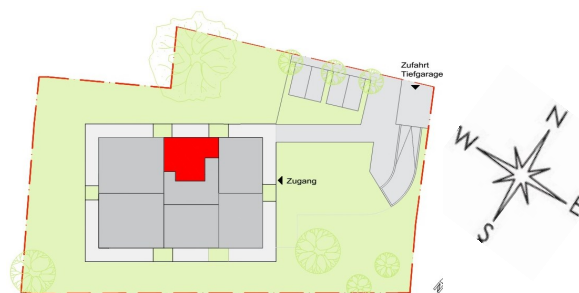
Lage Top 22

Bauträger Mag. Hofstätter & Kletzenbauer GmbH