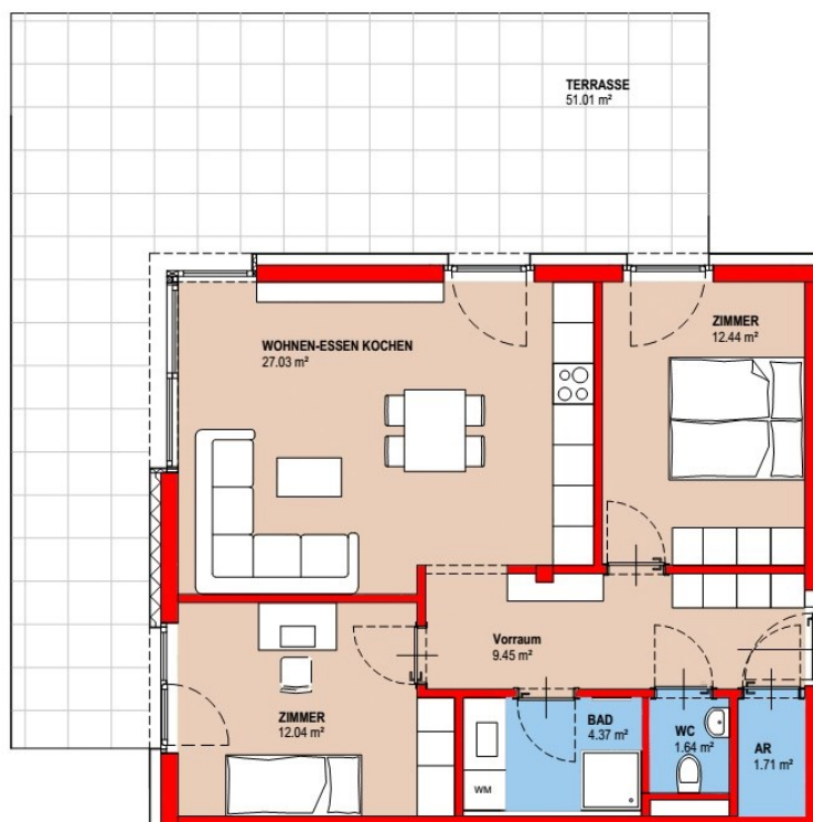
Lage Top 4